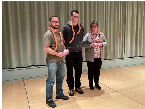
Die bekränzten Sieger der verschiedenen Gewehrtypen

Vollständige Rangliste (für Trefferbild Namen anklicken!):